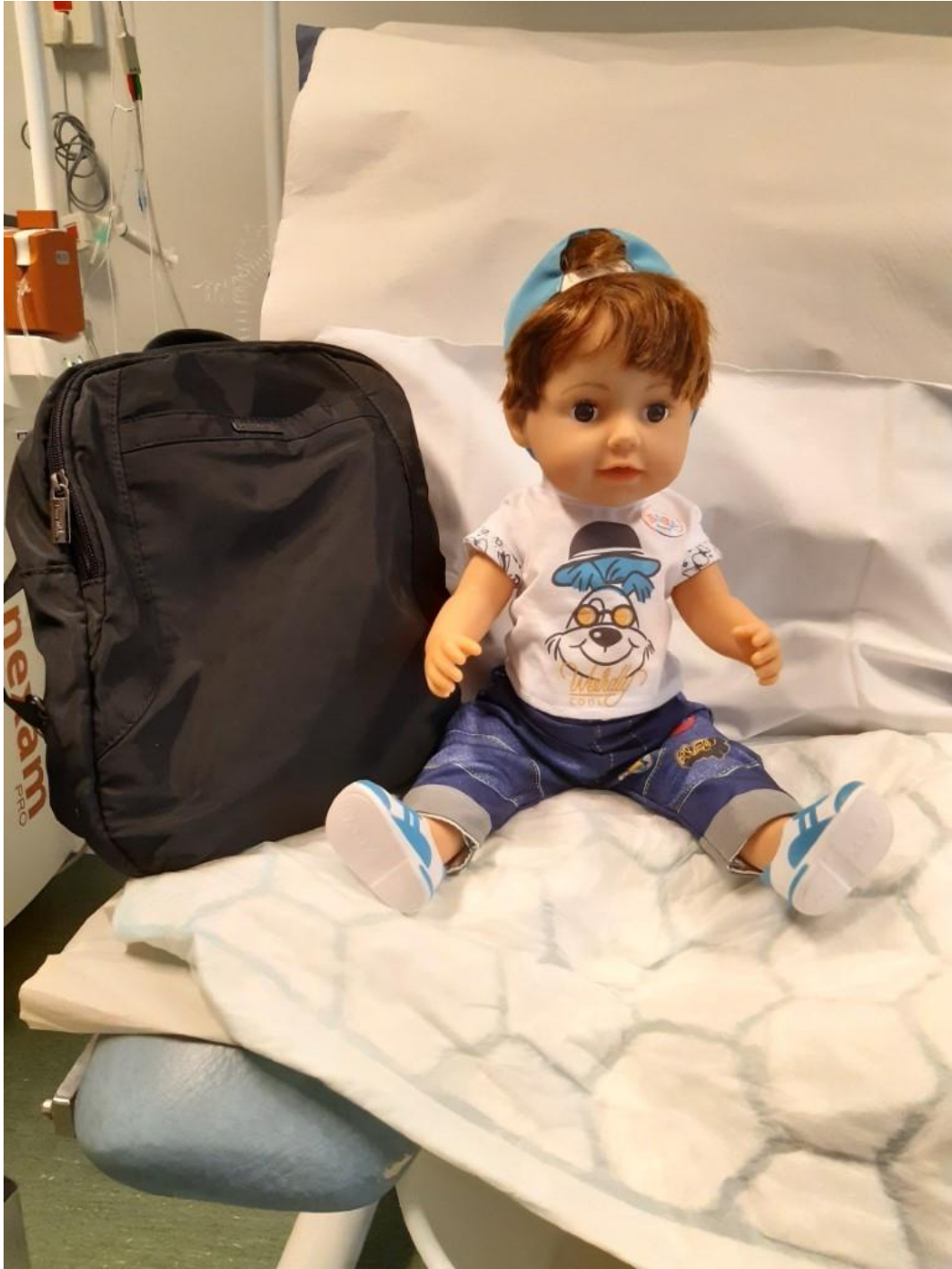
Minidatorn läggs i en ryggsäck