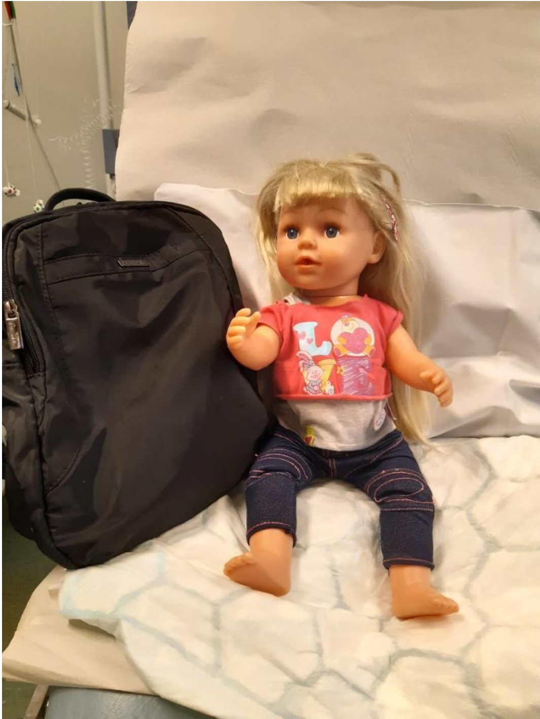
Minidatorn läggs i en ryggsäck