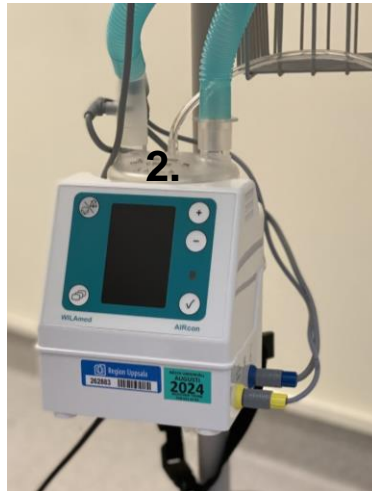
Bild 2 2. Kammare