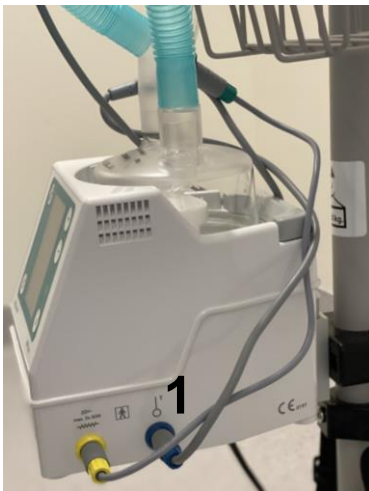
Bild 1 1. Temperatursenor