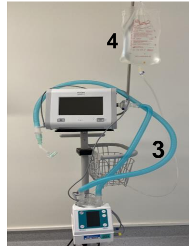
Bild 3 3. Gröna befuktningsslangar 4. Steril vatten till befuktare