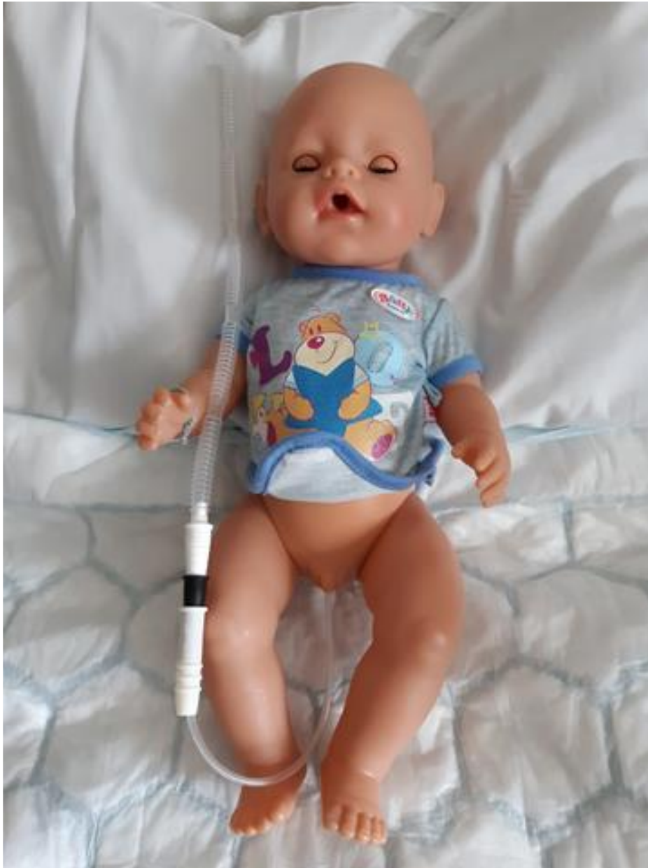
Sätt katetern precis som vid en vanlig tömning/RIK