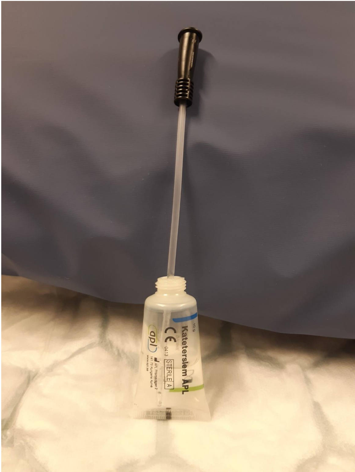
Doppa katetern i gel.