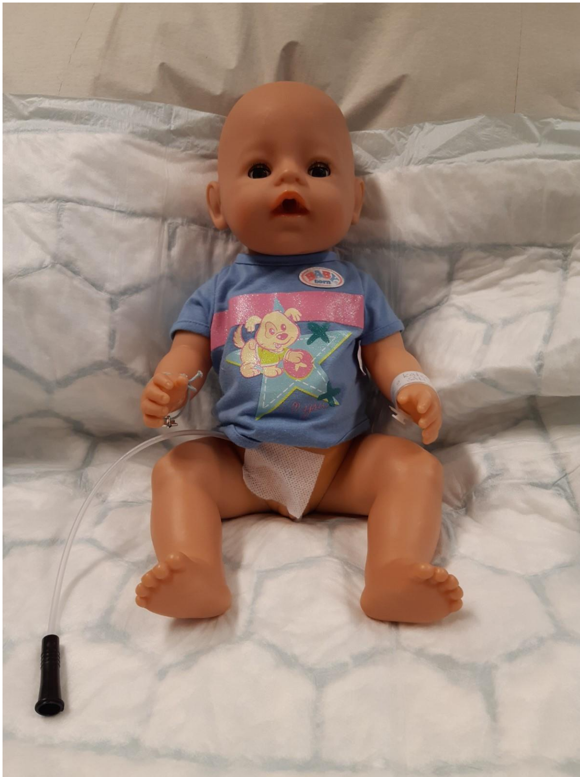
Tejpa fast katetern ovanför ljumsken.