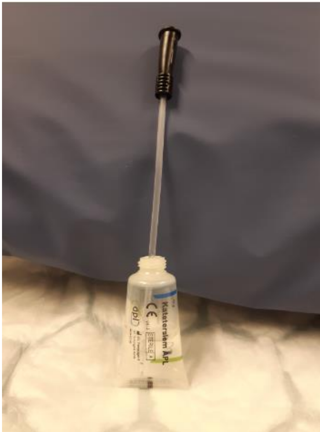
Doppa katetern i gel.