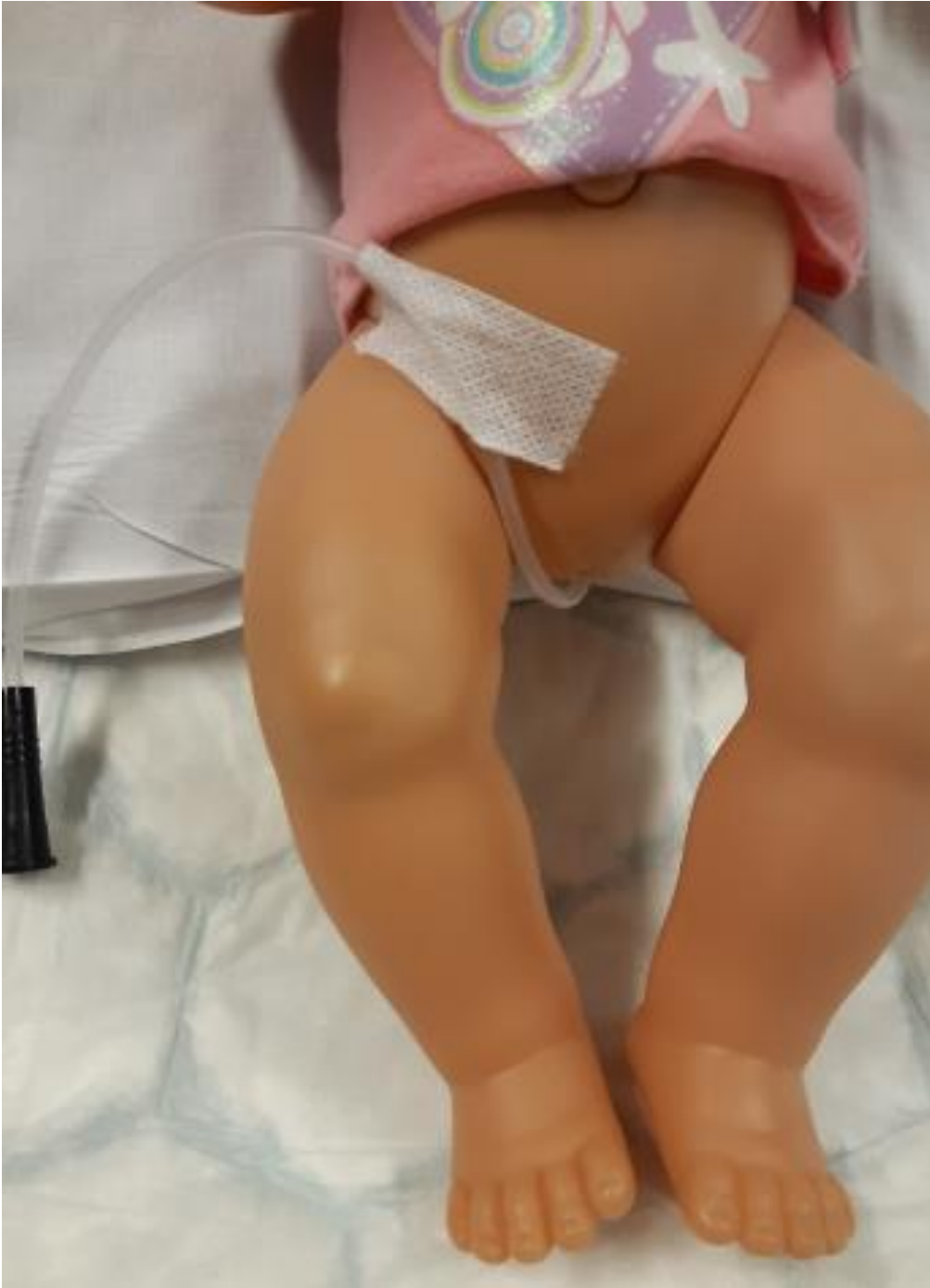
Tejpa fast katetern ovanför ljumsken.