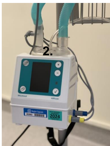
Bild 2 2. Kammare