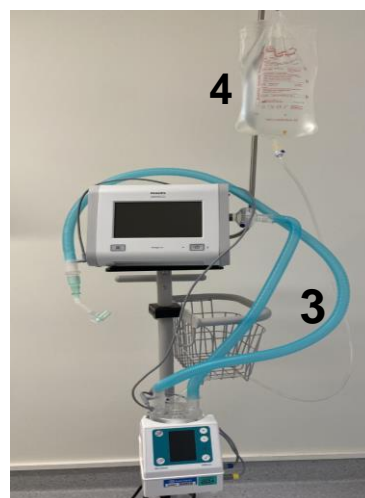
Bild 3 3. Gröna befuktningsslangar 4. Steril vatten till befuktare