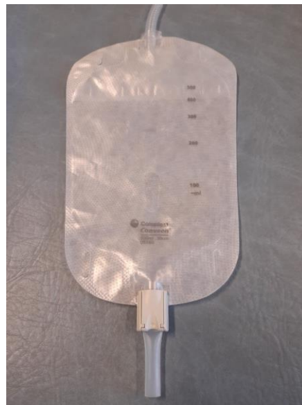
Stäng påsen med klämman.

Obs! Om man drar ned klämman lite över avtappningskranen innan man stänger den är det mindre risk att påsen går sönder.