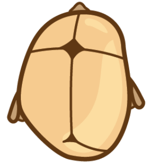
Figur 2: Lambdaidea kraniosynostos

Lambdaidea är namnet på suturerna som sitter i bakhuvudet. I de allra flesta fall av lambdaidea kraniosynostos sluter sig den ena lambdaideasuturen, d.v.s. antingen höger eller vänster sida. När huvudet växer kan bakhuvudet endast växa på ena sidan och resultatet är att bakhuvudet blir asymmetriskt. Bakhuvudet blir plattare på ena sidan och i typiska fall ser man också att örat sitter längre ner på den sidan där suturen är sluten. Skallen buktar ut på sidan motsatt den slutna suturen.