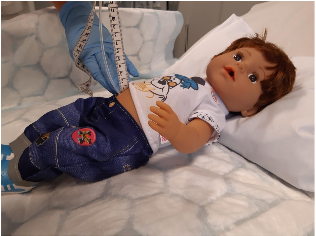
Lägg måttbandets "nolläge" vid barnets mage